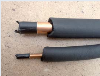
obr. 4 Udržet naprostou čistotu vnitřku trubek, do trubek se nesmí dostat prach, olej, ani voda.

Za společnost DAIKIN a Home Comfort Expert partnery Vám přejeme Perfect Comfort a dlouhou životnost Vašeho klimatizačního systému.