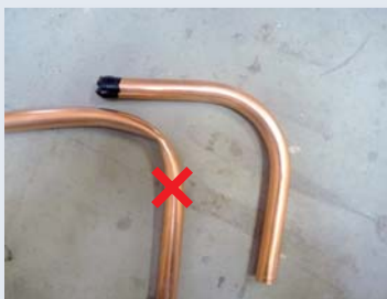
obr. 1 Nikdy nesmí dojít k zalomení potrubí.