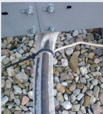
obr. 3 Při použití nekvalitní tepelné izolace dochází k rozpadu izolace...