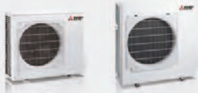
MUZ-RW25 / 35VGZ