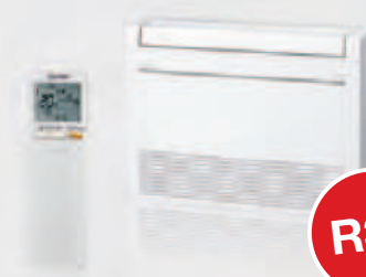
MUFG-KW25 - 60VG