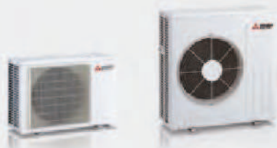
MUFG-KW25 / 35VGHZ